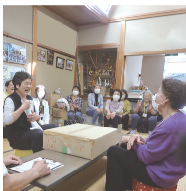
いきいき健康事業で脳トレ「ジャンケンでタオル取り」を体験（十字地区）