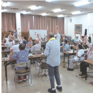
参加者も元気いっぱい敬老会（早川地区）