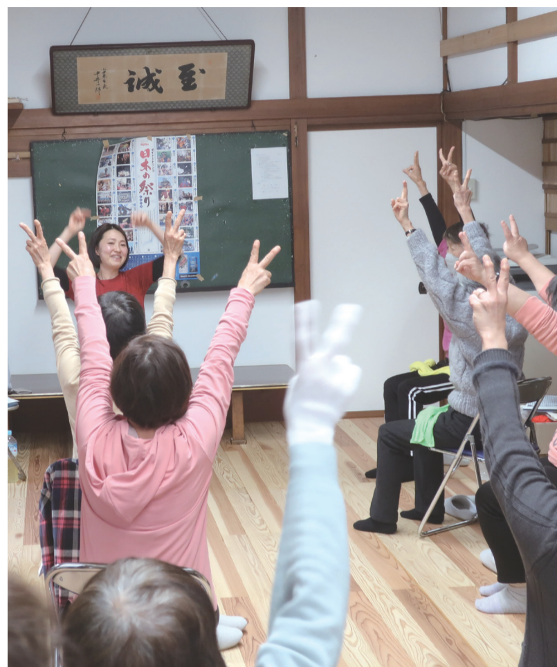
サロンでも元気に体操をして健康づくり（幸地区）

地域では、各種団体が住みよい環境づくりをめざして、さまざまな活動を行っています。このような活動をより効果的に進めることを目的に、地域内の諸団体の参加による地区社会福祉協議会（地区社協）が市内26地区の自治会連合会を単位に組織され、このページで紹介しているような活動をしています。社協会費はそのための貴重な財源として活用されています。