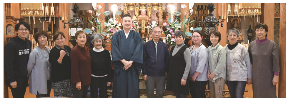
多種多様な楽器と演奏者が集う蓮華寺のミニコンサートは、地域の人たちが楽しむイベントとして「まちづくり委員会」の取り組みにも位置づけられて開催（上府中地区）下の写真は、地区社協の役員も参加しているイベントを主催する皆さん