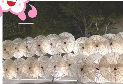
小田原の風景・57 「並んだ和傘の幻想的な景観」 曾我の傘焼きまつり